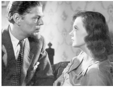
1946 UN INVITÉ VA VENIR (Det kom en gäst) d'Arne Mattsson avec Ivar Kåge