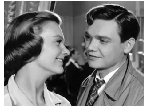
1957 INVITÉ DANS SA PROPRE MAISON (Gäst i eget hus) de Stig Olin avec Alf Kjellin