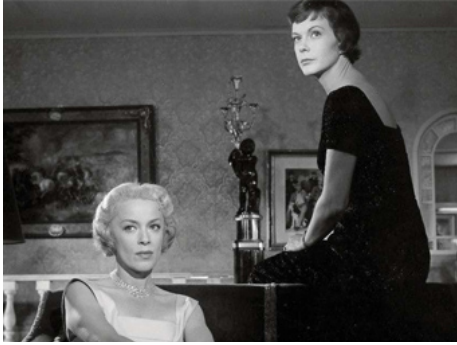
1957 LA FEMME EN NOIR (Damen i svart) d'Arne Mattsson avec Annalisa Ericson