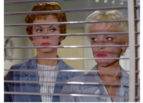
1958 LE MANNEQUIN EN ROUGE (Mannekäng i rött) d'Arne Mattsson avec Annalisa Ericson