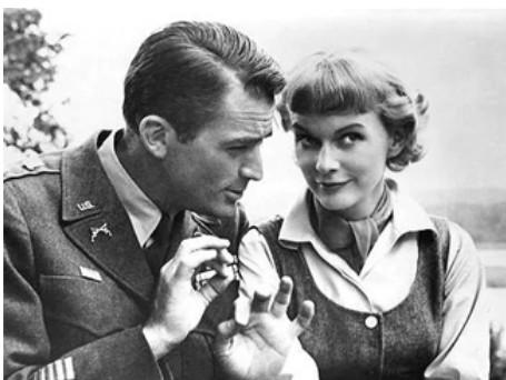
1953 LES GENS DE LA NUIT (Night People) de Nunnally Johnson avec Gregory Peck