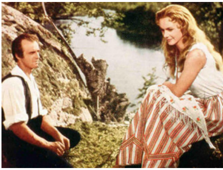
1956 LE CHANT DE LA FLEUR ROUGE (Sången om den eldröda blomman) de Gustav Molander avec Jarl Kulle