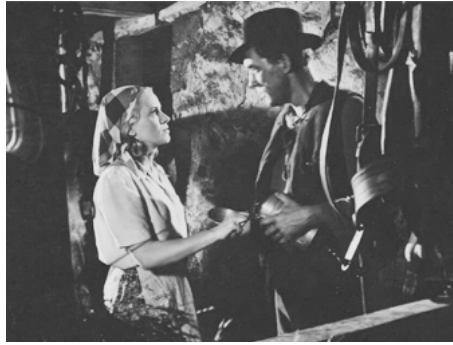
1948 SUR CES ÉPAULES (På dessa skuldror) de Gösta Folke avec Ulf Palme