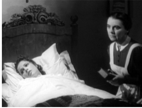
1958 LA CHARRETTE FANTÔME (Körkarlen) d'Arne Mattsson avec Ulla Jacobsson