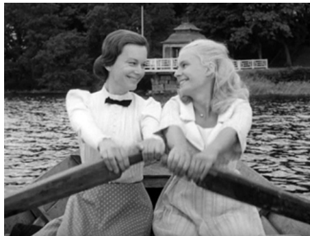
1964 LES AMOUREUX (Älskande par) de Mai Zetterling avec Gunnel Lindblom