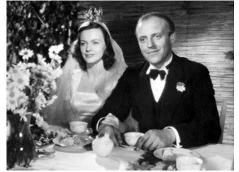
1949 LE ROYAUME DES HOMMES (Människors rike) de Gösta Folke avec Erik Hell