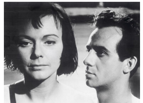
1951 L'ATTENTE DES FEMMES (Kvinnors väntan) d'Ingmar Bergman avec Birger Malmsten