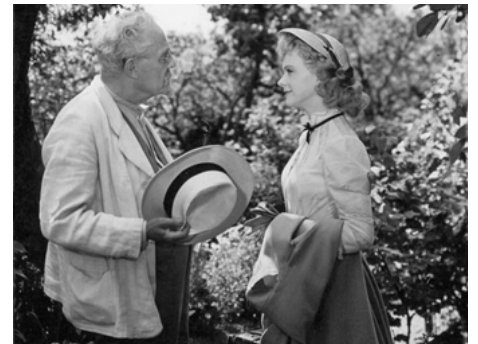
1950 LE QUATUOR ÉCLATÉ (Kvartetten som sprängdes) de Gustaf Molander avec Victor Sjöström