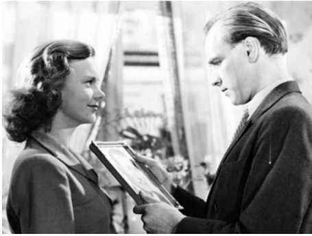
1947 PAS DE RETOUR POSSIBLE (Ingen väg tillbaka) d'Edvin Adolphson avec Olof Bergström