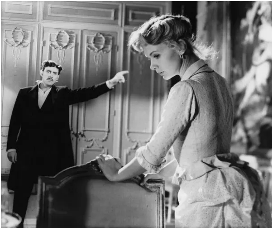
1950 MADEMOISELLE JULIE (Fröken Julie) d'Alf Sjöberg avec Ulf Palme