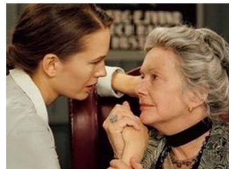
2000 LES FAISEURS D'IMAGE (Bildmakarna) d'Ingmar Bergman avec Ellin Klinga