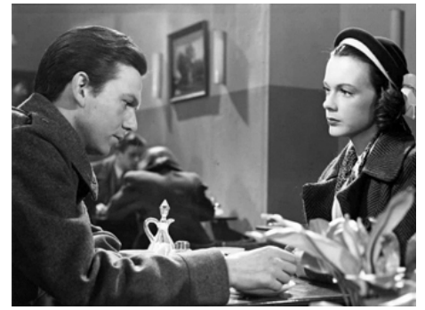
1947 LA FEMME SANS VISAGE (Kvinna utan ansikte) de Gustaf Molander avec Alf Kjellin