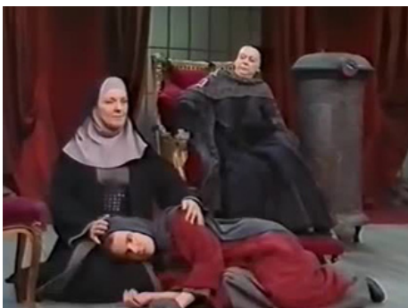
1992 LA MARQUISE DE SADE (Marksinnan de Sade) d'Ingmar Bergman avec Stina Ekblad