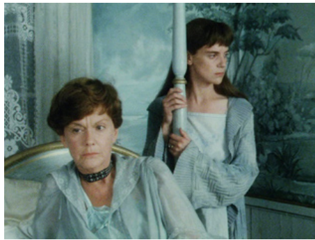
1985 AMOROSA (Amorosa) de Mai Zetterling avec Stina Ekblad